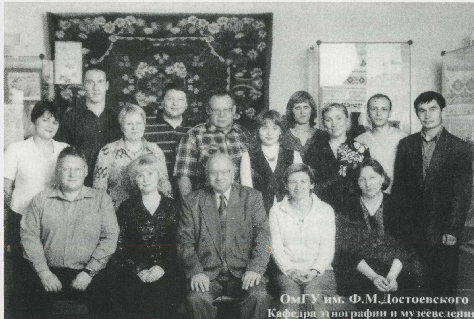
ОмГУ им. Ф.М. Достоевского Кафедра этнографии и музееведения